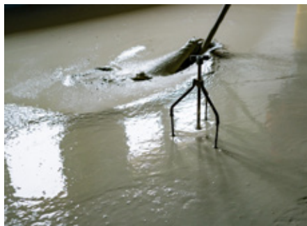
Abb. 1: Nivellierbock zur Einhaltung des geplanten Höhengniveaus

Die hohe Ebenheit des Fließestrichs wird erreicht, indem der Estrichmörtel gleich-