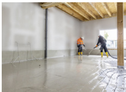
Abb. 2: Gleichmäßige Verteilung des Fließestrichs auf den Flächen