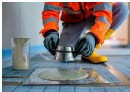
Abb. 5: Ziehen des Haegermanntrichters zur Prüfung des Durchmessers

der schnellen Festigkeitsentwicklung kann mit der Trocknung früh begonnen werden. Dabei sind Verformungen (Schüsseln etc.) nicht zu befürchten. Ausführliche Hinweise zur Trocknung von Fließestrichen finden sich im Merkblatt Nr. 2.