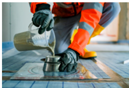
Abb. 4: Befüllung des Haegermanntrichters mit Fließestrich

Die Mörtelkonsistenz wird fachgerecht mit Hilfe des Fließmaßes bestimmt. Das Fließmaß ist der Durchmesser des sich bei der Prüfung ausbreitenden Mörtels; es wird je nach Herstellerangaben mittels Fließmaßdose, Haegermanntrichter (Abb. 4, 5), Vicatring o.Ä. gemessen.